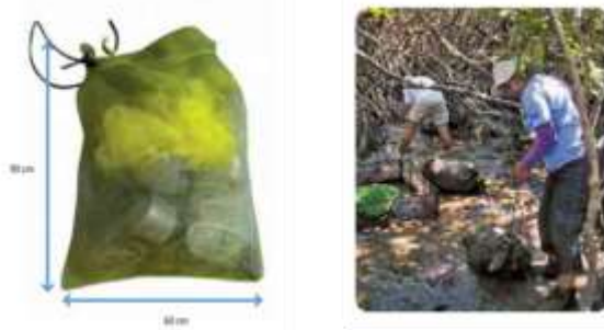
Figura 4. Bolsas de malla para colocar los moluscos en los viveros.